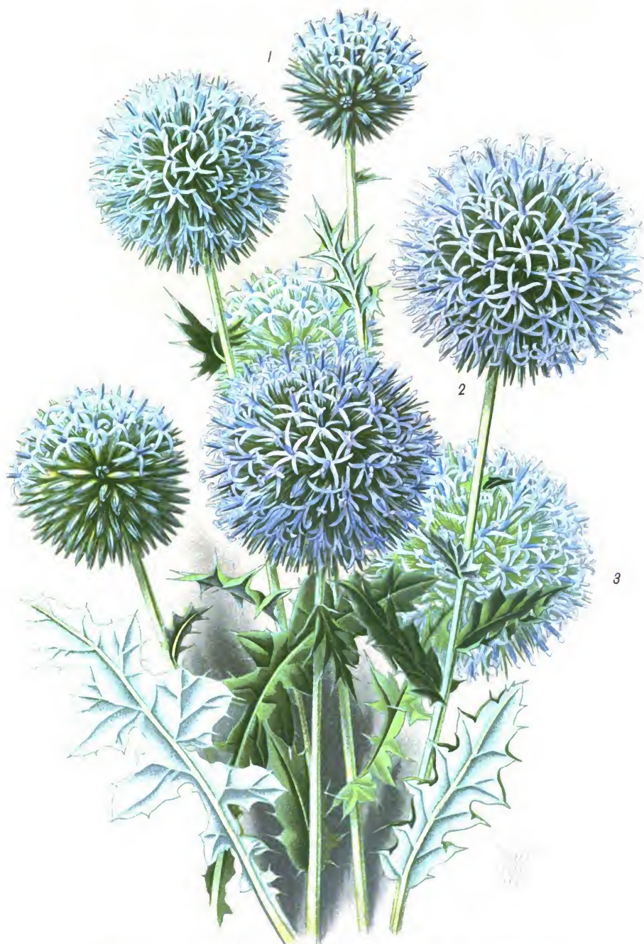
Echinops humilis (1); E. Ritro (2); E. hybridus (3).

Мордовник низкий [1.]; М. терновый [2.]; М. гибридный [3.].